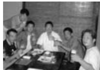
ラウンド後の懇親会様子