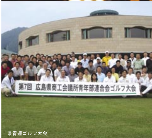
県青連ゴルフ大会