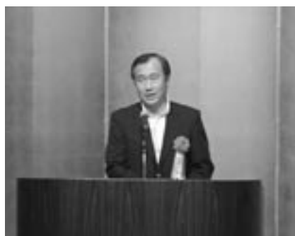
秋葉忠利広島市長祝辞