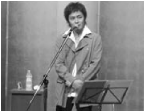
講師 ミュージシャン原田真二氏

二〇〇〇年より明治神宮、伊勢神宮、厳島神社を含む全国の神社でコンサートを行っています。自然を舞台にし、地元の皆様と共に力を合わせて作り上げていくので、大変な労力が必要になります。そして本番を迎えたときの感動達成感は素晴らしいものです。