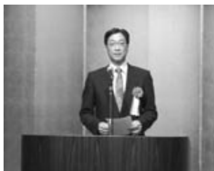
藤田雄山広島県知事祝辞