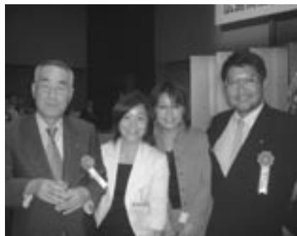
池内前会頭と金谷副会頭と会員