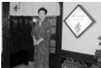
▲気さくな女将さん。歴史を感じる店構えです。▶隠れ家のような店内で旬の肴に舌鼓！