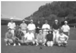
第24回 参加メンバー