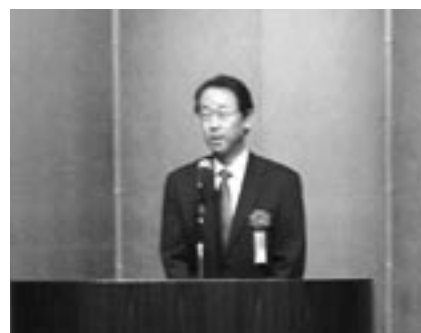
中国経済産業局 大庭部長祝辞