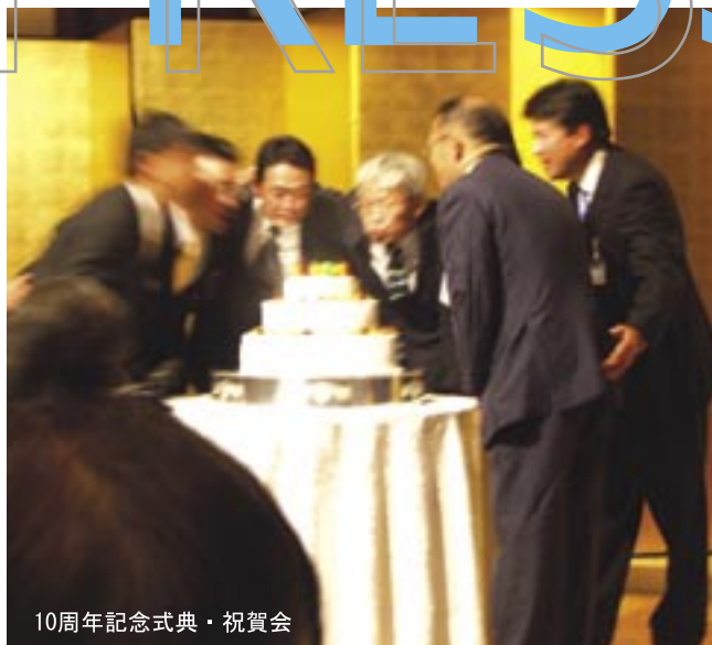
10周年記念式典・祝賀会