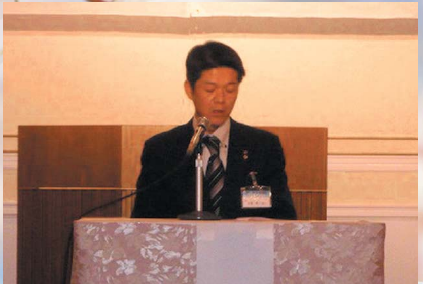
安田会長お疲れ様でした