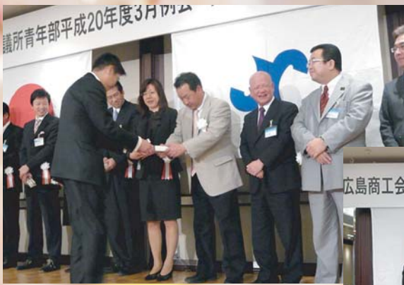
卒業生のみなさま、 卒業おめでとうございます