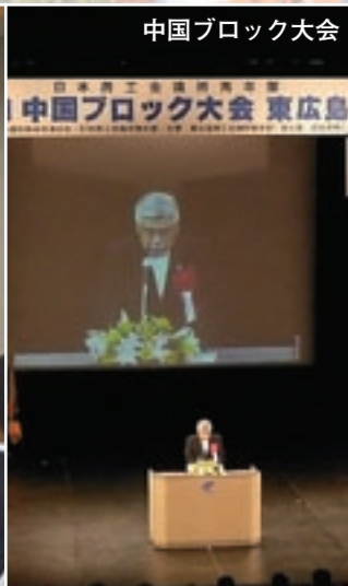
中国ブロック大会