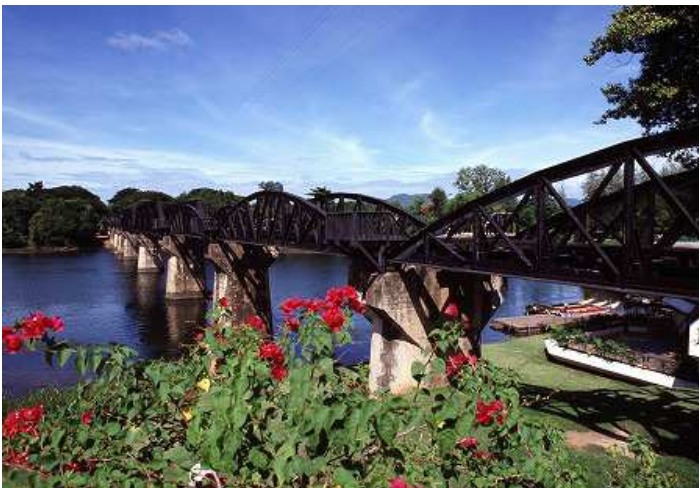
「映画にも出ていた鉄橋」