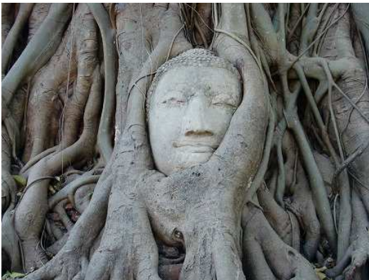
「ワット・マハータート」

いわずと知れたタイの世界遺産アユタヤ！！ チャオプラヤー川のほとりに広がる古都の遺跡群には、 417年間に渡りアユタヤ王国が築いた歴史が眠っています。 アユタヤにある寺院を巡り、歴史を感じましょう。 バンコクが初めての方、特におすすめです！！