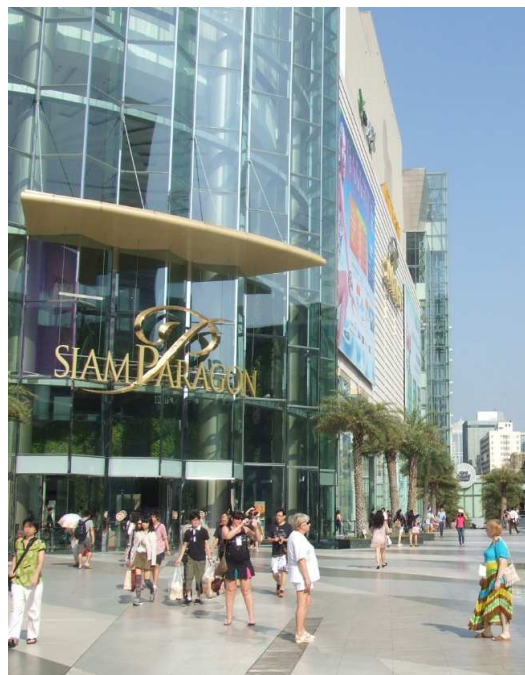
「バンコクのデパート、サイアムパラゴン」