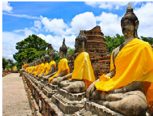
「ワット・ヤイ・チャイ・モンコン」