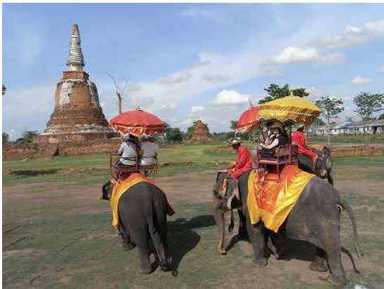
象に乗って遺跡巡り