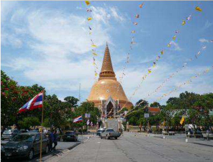
「世界最大のプラ・パトム・チェディ」

カンチャナブリは、泰緬鉄道（いわゆる“死の鉄道”）の橋で知られる場所です。 連合軍捕虜らが第二次世界大戦中に建造し、映画『戦場にかける橋』で有名になった鉄橋です。 またナコンパトムは世界最大の仏塔（プラ・パトム・チェディ）を有し、これも必見です！！